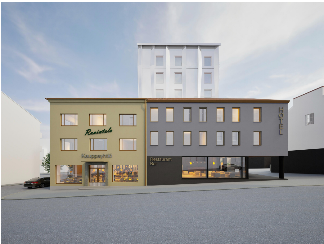
Kuva 6. Kaavan havainnekuva

Kaavamuutos mahdollistaa Valtakadun kolmekerroksisen osan rakentamisen uudelleen. Uudisrakennuksen räystääslinja tulee sitoa olemassa olevan Kauppayhtiön rakennuksen räystääslinjan korkeustasoon. Uudisosan kattomateriaali tehdään yhtenäisenä Kauppayhtiön mukaan.