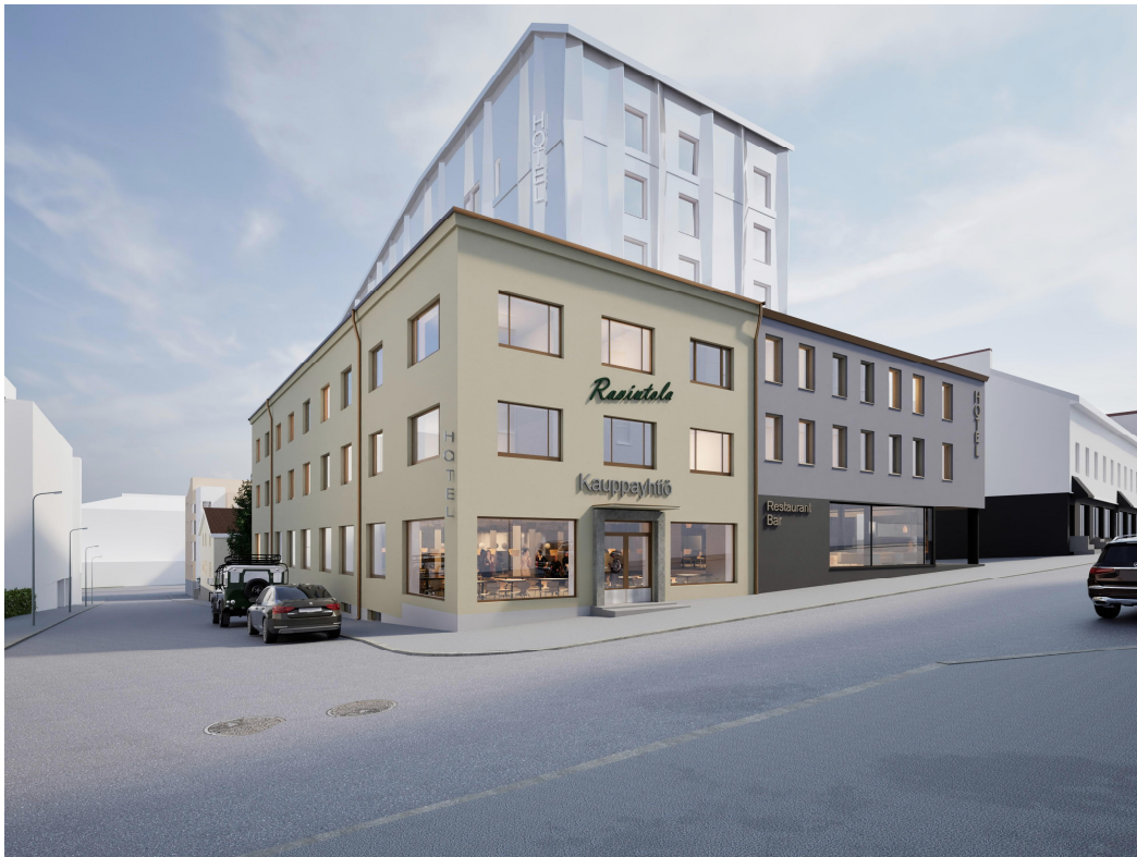
Kuva 4. Kaavan havainnekuva

Valtakadun puoleisen uudisosan hahmon ja räystäään tulee noudattaa viereisen Kauppayhtiön ja Haaveen linjaa, mutta rakennus voi olla julkisivumateriaaliltaan ja ilmeeltään nykyaikainen.