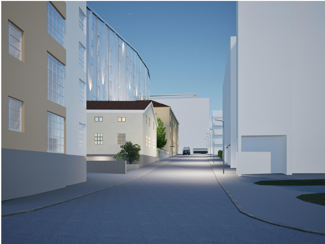
Kuva 7. Kaavan havainnekuva

Kauppayhtiön varistorakennuksen merkinnän perusteena ovat niin ikään kulttuurihistoriallinen arvo ja kaupunkikuvallinen arvo. Talo rakennettiin viereisellä tontilla olevan kauppayhtiön varastoksi. 1944 hävityksessä rakennus vaurioitui pahoin, mutta kantavat rakenteet säilyivät. Länsipuolen siipirakennus on vuodelta 1938. Varaston lisäksi rakennuksessa on toiminut mm. Autoliike Rauman korjaamo ja Pakarin leipomo.