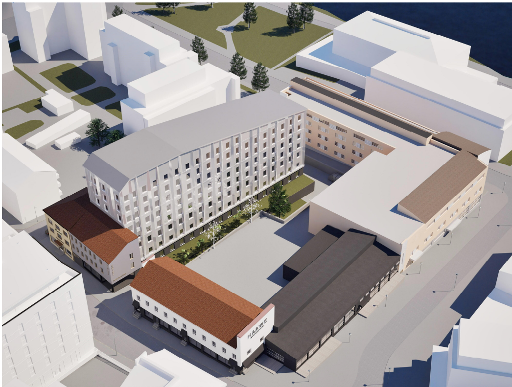
Kuva 3. Kaavan havainnekuva

Korkean rakennusmassan tulee olla veistosmainen kappale. Korkean massan ylimmän kerroksen tasalle voidaan toteuttaa kattoterassi. Kattoterassin mahdollinen katos on toteutettava visuaalisesti kepeänä rakenteena, esimerkiksi lasisena.