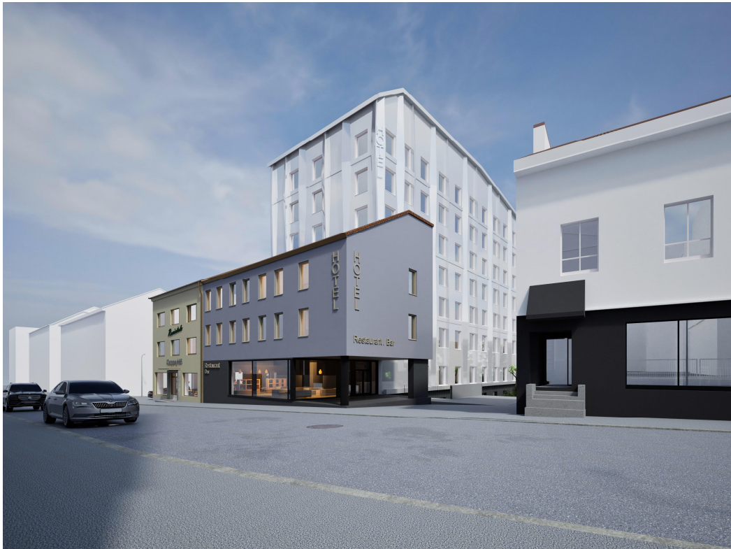
Kuva 2. Kaavan havainnekuva

Ajoneuvoliikenne liittyy tontille Harrikadun puolelta. Tontin pysäköinti sijaitsee kannen alla/ kellarikerroksessa. Tontin huoltoliikenne on saman liittymän kautta. Pääosa tontin huolto- ja varastotoiminnoista on kellarissa/ Pohjanpuistikon puoleisessa jalustakerroksessa. Ajoneuvoyhteys Valtakadulta naapuritontille 7 on osittain Kauppayhtiön tontilla ja yhteys on säilyttävä jatkossakin.