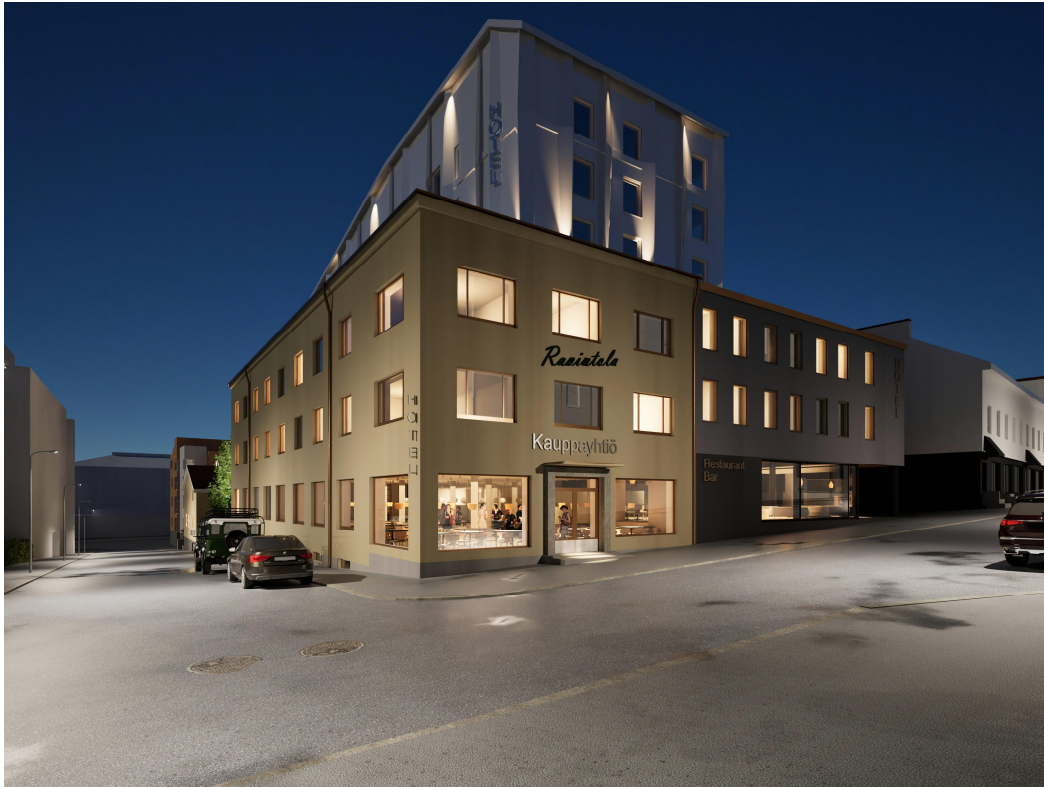
Kuva 5. Kaavan havainnekuva

Korkean massan veistomaista ulkomuotoa sekä suojeltujen ja uusien rakennusten ominaispiirteitä on hyvä korostaa hienovaraisella julkisivuvalaistuksella. Valaistus on toteutettava siten, että sen tehoa voidaan säätää.